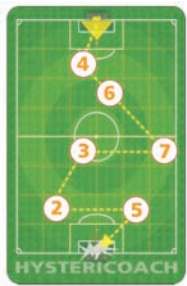
FIGURA 2 AL TERMINE DELL'AZIONE LA PALLA DEVE TROVARSI AI PIEDI DELLA PEDINA COL N. 5 E SARÀ IL GIOCATORE IN POSSESSO DELLA CARTA "5" A DOVER TIRARE IL DADO.

Se dopo un gol i giocatori si dovessero attendere in festeggiamenti togliendosi la maglia, facendo il trenino (soprattutto in presenza di giocatrici), l'aeroplanino o irridendo gli avversari e dovessero rallentare la ripresa del gioco, sarà concesso (all'arbitro o all'allenatore avversario) l'utilizzo del mezzo disciplinare, cioè la presa di Spock!